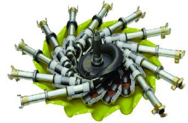
CLAAS 持久润滑密封型搂草齿轮箱, 和球墨铁铸的凸轮导轨最大限度地保证了使用的安全性和牢固性。