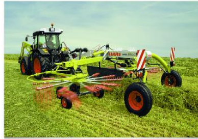
万向悬挂转盘作为地面仿形装置, 具有最佳的三维适应性。