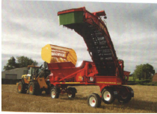
CTM 9001 XL