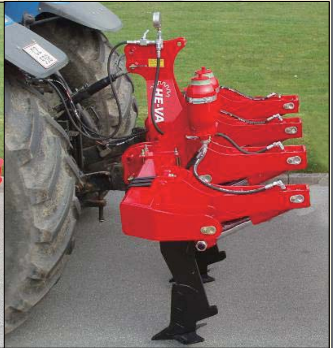
3米4齿液压自适应过载保护新系统，方型镇压辊，液压调节作业深度