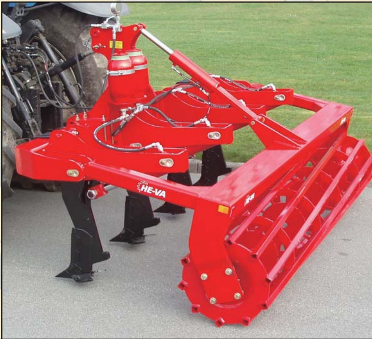
3米4齿液压自适应过载保护系统，方形管镇压辊，液压调节作业深度