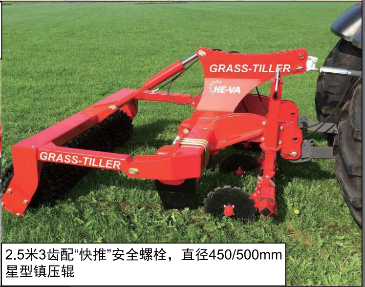
2.5米3齿配“快推”安全螺栓，直径450/500mm 星型镇压辊