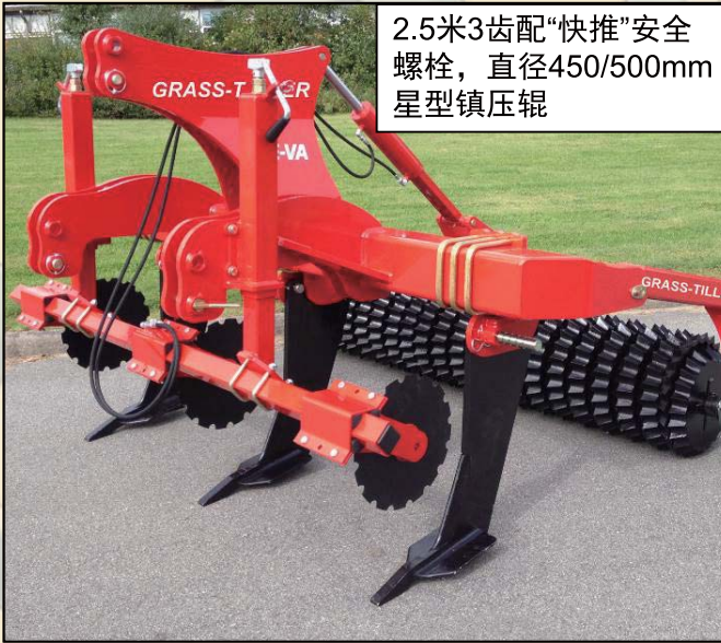
2.5米3齿配“快推”安全螺栓，直径450/500mm 星型镇压辊